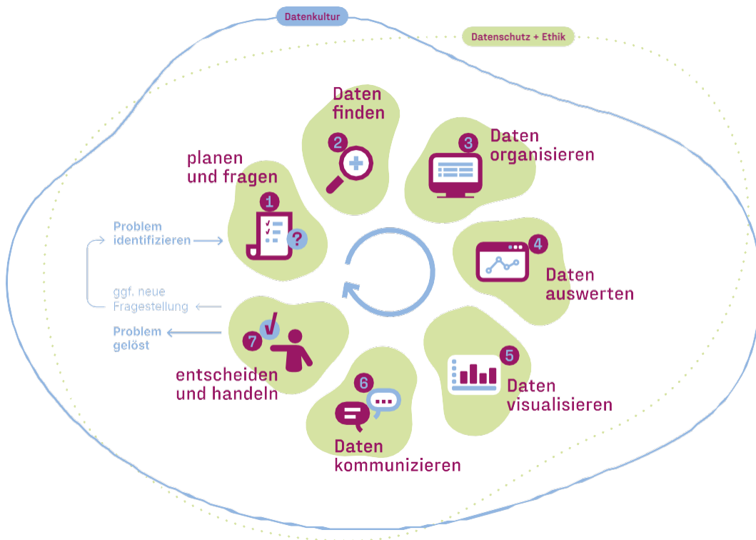
Abbildung 1: Der Datenlebenszyklus des Civic Data Lab.

Zum Datenlebenszyklus gibt es auch eine interaktive Website mit Kompetenzbeschreibungen und Lernempfehlungen. Die Quellen, die für die Entwicklung des Datenlebenszyklus und der Kompetenzbeschreibungen verwendet wurden, sind unter weiterführende Links angegeben.